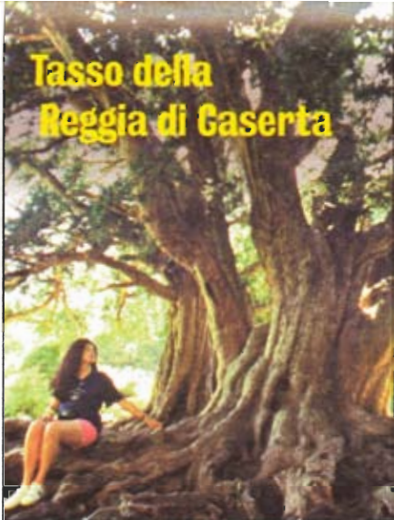
Tasso della Reggia di Caserta

Ortona-Vasto. Si procede in auto verso Pescocostanzo, esempio medievale di uso intelligente del territorio. Nel bosco di Sant'Antonio ci viene incontro un grande faggio a candelabro che è emblematico della sacralità di quei luoghi. È il faggio di Sant'Antonio, al-