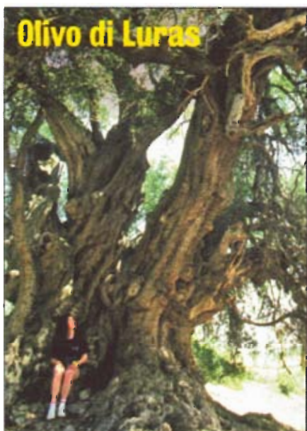
Olivo di Luras