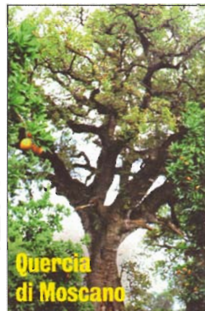
Quercia di Moscano

CINQUE RARITÀ CHE HANNO SCONFITTO IL TEMPO Sopra, da sinistra: il magnifico olivo sardo di Luras, nella zona di Tempio Pausania, che ha duemila anni e una circonferenza di 11 metri; uno dei faggi giganti della foresta umbra («umbra» nel senso di «all'ombra») all'interno del Parco nazionale del Gargano, alto 30 metri e «largo» quasi 5; la plurisecolare quercia di Moscano, in provincia di Ancona, alta 24 metri e con una circonferenza di quasi 6. In alto, a sinistra, il tasso della Reggia di Caserta, detto anche «albero della morte» perché velenoso. Infine, sul litorale di Taormina, poco lontano dal Castagno dei cento cavalli, si incontra il pistacchio di Bronte: ha 250 anni e una circonferenza di oltre due metri.