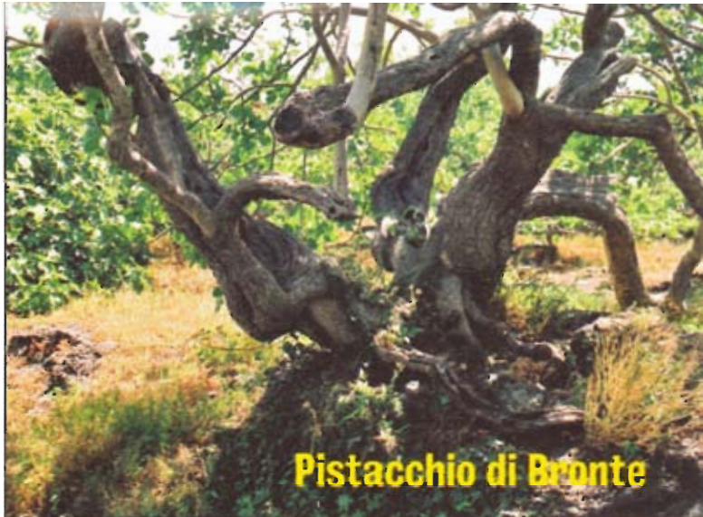
Pistacchio di Bronte