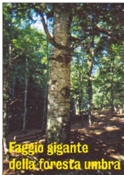
Faggio gigante della foresta umbra