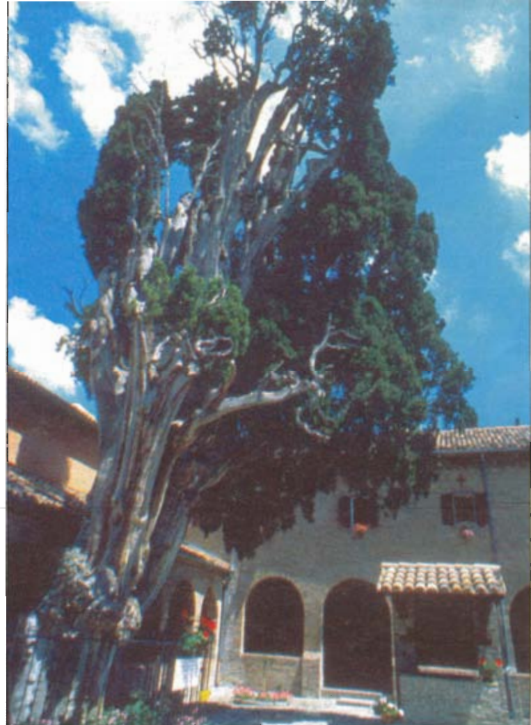
FU PIANTATO DA S. FRANCESCO Verucchio (Rimini). L'albero storico dell'Emilia-Romagna, il cipresso di San Francesco, alza la sua chioma (che ha raggiunto anche i 32 metri d'altezza) nel convento. Un documento attesta che nel 1213 fu piantato dal poverello di Assisi.

● C'è anche Al Bano. L'iniziativa ha coinvolto i migliori ulivicoltori del Sud (fra cui l'azienda agricola di Al Bano). In pratica, si invitano le famiglie ad adottare a distanza uno o più ulivi secondo il consumo necessario annualmente (tenendo conto che ogni albero produce in un anno 20 kg d'olio). A ogni richiesta, il produttore mette sull'ulivo adottato un adesivo con la scritta «Di proprietà della famiglia...» e ne invia una foto agli acquirenti con invito a recarsi sul luogo quando è tempo di raccolta. Per ogni albero gli acquirenti verseranno una cifra simbolica (10-15 euro) e pagheranno il loro olio, dopo la molitura, a una cifra conveniente. Per saperne di più: telefono 080-54.71.701. r.l.