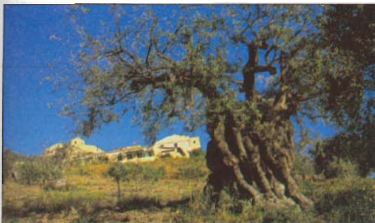
DAL VECCHIO TRONCO È NATA UNA NUOVA PIANTA Agrigento. Nella campagna di Contrada Mosè spicca questo ulivo plurisecolare: sulla grossa ceppaia si sono sviluppati i nuovi rami. La Sicilia è ricca di questi ulivi secolari. Tra tutti ricordiamo quello di Pollina (Palermo).