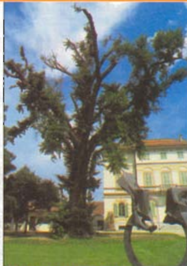
UN GINKGO DALLA CINA Casalbeltrame (Novara). Un ginkgo biloba che vegeta nel parco della villa Gautieri-Braçorens. È originario della Cina.