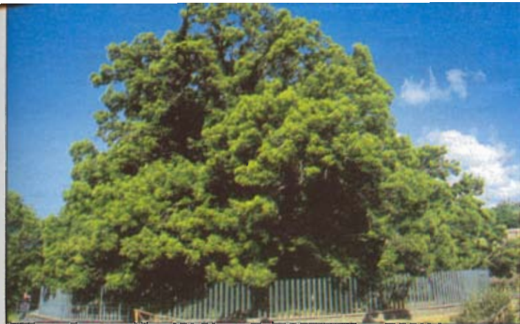
IN SICILIA C'È IL CASTAGNO PIÙ ANTICO D'EUROPA Catania. Il castagno di S. Alfio è l'albero dei primati: il più vecchio d'Europa (3.000 anni) e il più grande d'Italia (circonferenza di 22 metri). Nel XIV secolo avrebbe riparato dalla pioggia i 100 cavalieri della regina Giovanna d'Aragona.