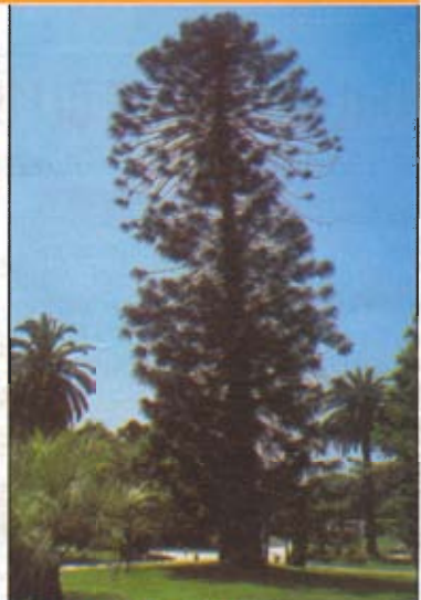
IL "RE" DEL CILE Caserta. All'ingresso della reggia, c'è questo araucaria alto 30 metri. Il suo nome deriva da Arauco, provincia del Cile.