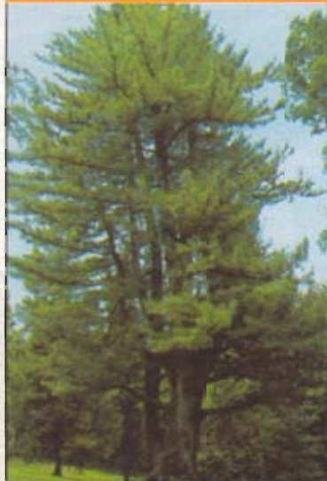
VIENE DALL'HIMALAYA Santorso (Vicenza). Nel parco di Villa Rossi c'è questo imponente pino. Viene dall'Himalaya ed è alto 28 metri.